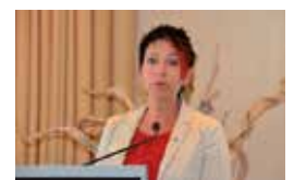
Nationalrätin Sandra Sollberger.