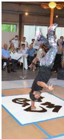
«La Furia» tanzte und malte.

MGVBL nimmt an der Berufsschau teil. Seite 4