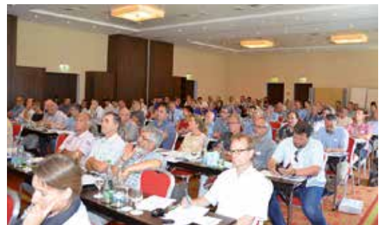
Der offizielle Teil der DV fand im Hotel Marriott statt.